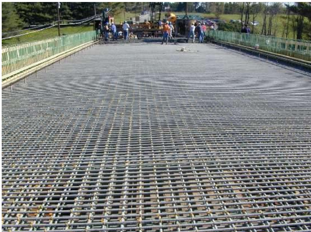
Gambar : Susunan tulangan lantai s \geq 200 mm (internet).